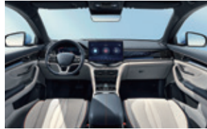
Azul y gris